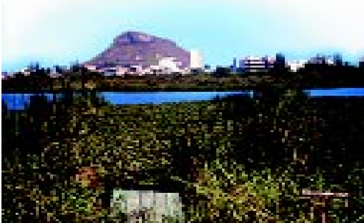
Figura 2. A Lagoinha, que serviu de modelo de estudo, está situada na baixada de Jacarepaguá (RJ), no Parque Ecológico Chico Mendes

muns em ambientes tropicais. Várias evidências indicam a ampla metilação do Hg em sistemas invadidos por tais plantas. Suas raízes, que retêm partículas em suspensão na água e outros detritos, são colonizadas por microalgas e bactérias. Nesse microambiente, a intensa atividade microbiana e a produção de compostos húmicos e fúlvicos (que podem fornecer radicais metil) favorecem a metilação. Como muitos organismos aquáticos passam parte da vida nessas raízes, a bioacumulação do composto, mais disponível nesse ambiente que no sedimento de fundo, é facilitada.